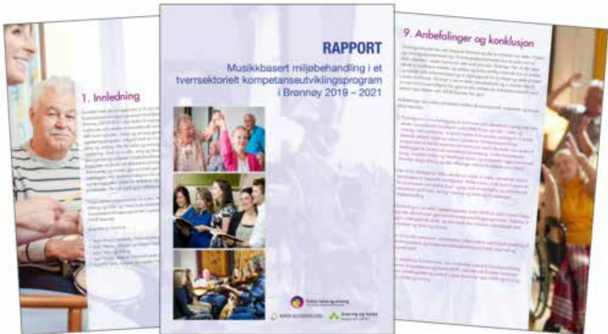
Musikkbasert miljøbehandling i et tverrsektorielt kompetanseutviklingsprogram i Brønnøy". Illustrasjon: Kulturskolerådet https://www.kulturskoleradet.no/nyheter/2022/oktober/mmb-rapport-med-anbefalinger