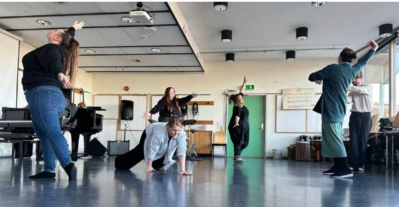
Studenter i Musikkbasert miljøbehandling høsten 2022 får prøve ut praktisk verktøy i dans for å kjenne på tilstedeværelse og bidra i en skapende prosess som kan tilpasses målgruppen.