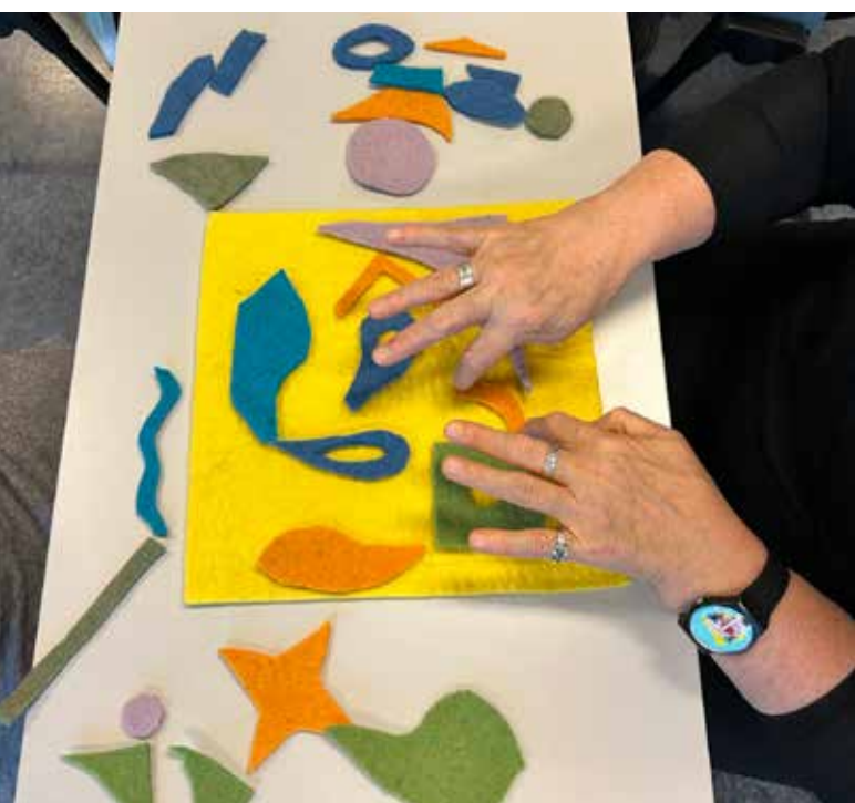
Studenter i "kunst og kultur i helse og omsorg" får teste ut "Mønster" som handler om å møtes gjennom en kunstdidaktisk praksis i en helsekontekst og om hvordan bruk av materialet felt kan gi nytt innhold, mestring og glede i hverdagen.

http://kulturoghelse.no/wp-content/uploads/2019/09/veileder-mnster.pdf