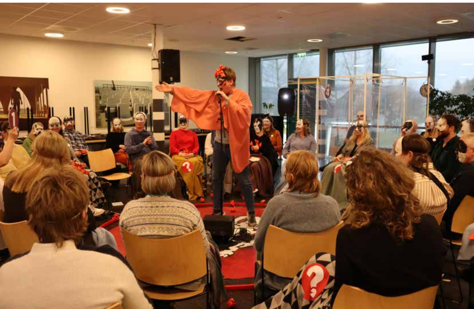
Fra den interaktive forestillingen om psykisk helse etter pandemien, "Hvordan har du det?", under vårmøtet til Folkehelsealliansen Trøndelag.