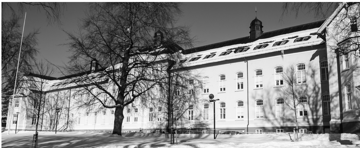
Nasjonalt kompetansesenter for kultur, helse og omsorg har kontorsted ved Nord universitet, Campus Levanger

Nasjonalt kompetansesenter for kultur, helse og omsorg (etablert 1. juli 2014) er organisert som et partnerskap som blir administrert av Nord universitet. Rektor har lagt senteret til Fakultet for lærerutdanning og kunst- og kulturfag ved campus Røstad i Levanger.