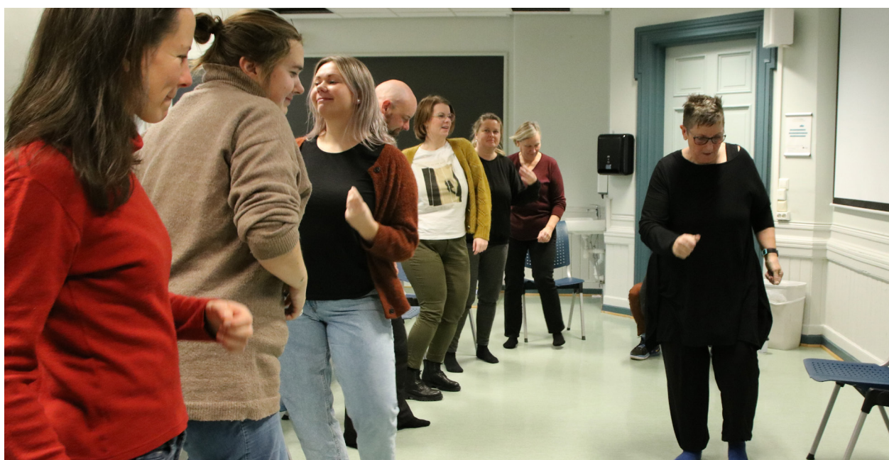
Studenter i Musikkbasert miljøbehandling høsten 2021.

Fagdagen til sykepleierstudier var 4 timer innføring i miljøbehandling med enkle musikkbaserte miljøtiltak for målgruppene eldre, personer med demensdiagnose og personer med nedsatt kognitiv funksjon.