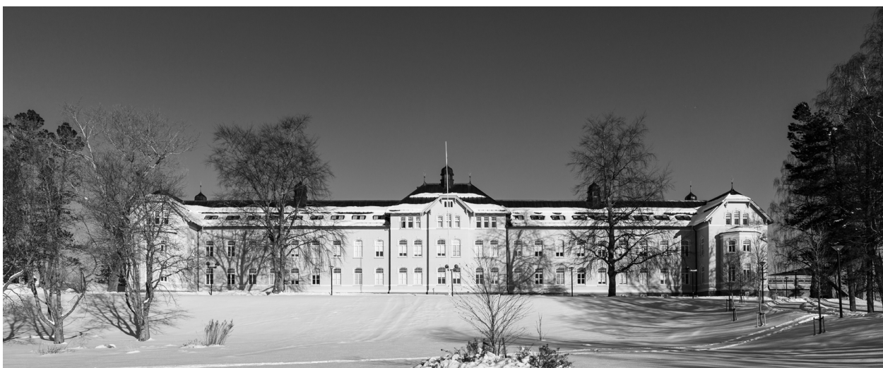
Nasjonalt kompetansesenter for kultur, helse og omsorg har kontorsted ved Nord universitet, Campus Levanger

Kompetansesenteret finansieres via en egen post på Statsbudsjettet, Helsedepartementet, med en grunnbevilgning på tre millioner kroner årlig (kap. 761, post 79).