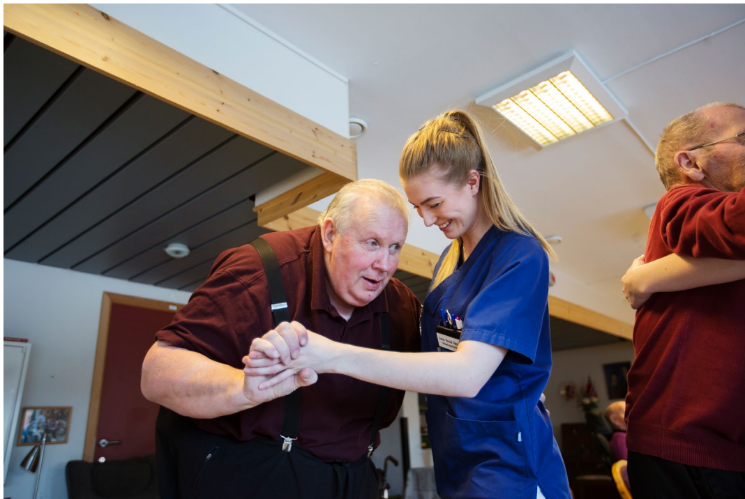
Målgruppen for opplæringsprogrammet Musikkbasert miljøbehandling er ansatte og ledere i helsesektoren.

Nasjonal kompetansetjeneste for aldring og helse (Aldring og helse) har en viktig rolle i arbeidet i og med at det er utviklet en egen ABC-opplæring som del av opplæringsprogrammet i MMB – ABC Musikkbasert miljøbehandling.