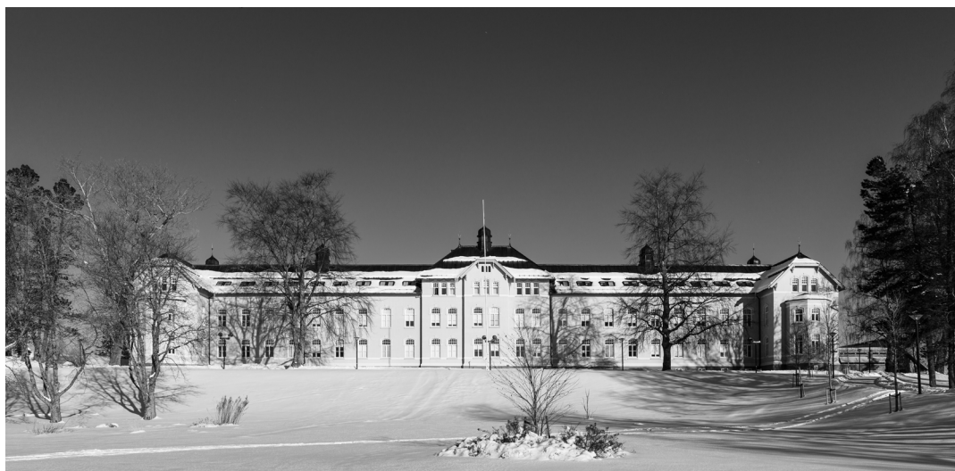
Nasjonalt kompetansesenter for kultur, helse og omsorg har kontorsted ved Nord universitet, Campus Levanger.

Kompetansesenteret finansieres via en egen post på Statsbudsjettet, Helsedepartementet, med en grunnbevilgning på tre millioner kroner årlig (kap. 761, post 79).