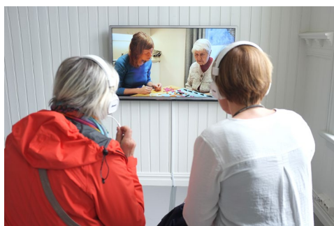
Bildet er fra kunstprosjektet Mønster. Der brukes materialet filt til å berike hverdagen til ansatte og personer med demens.