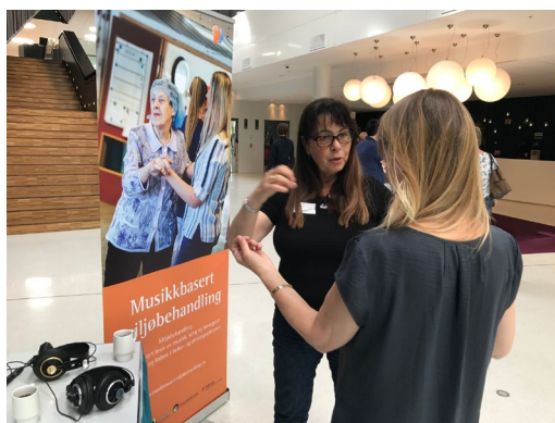
Konferansedeltakere fra Musikkbasert miljøbehandling – en nyvinning i pleie og omsorg.